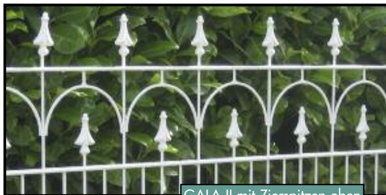
GALA II mit Zierspitzen oben

Als Montagebausatz zur Selbstmontage oder auch mit Montage durch unsere erfahrenen Montageteams lieferbar.