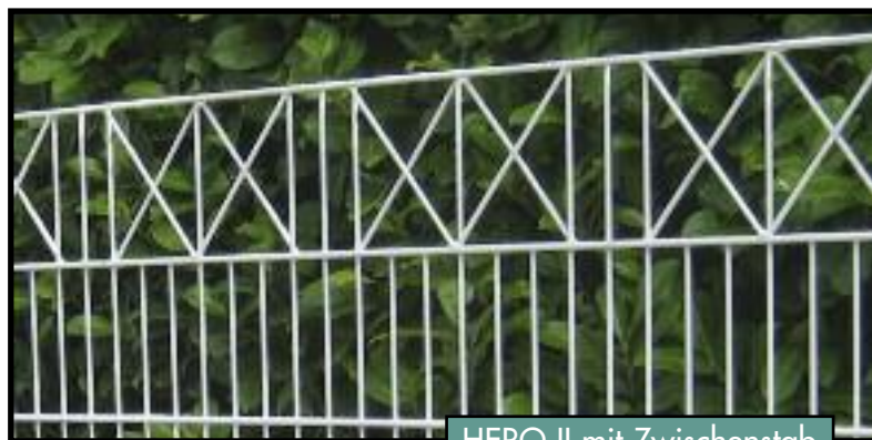
HERO II mit Zwischenstab

Als Montagebausatz zur Selbstmontage oder auch mit Montage durch unsere erfahrenen Montageteams lieferbar.