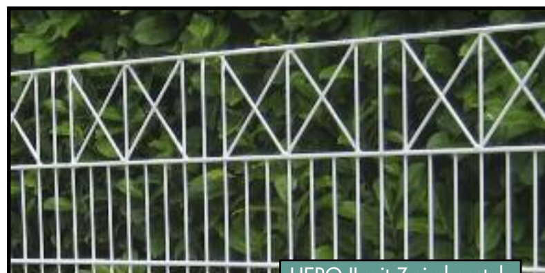
HERO II mit Zwischenstab

Als Montagebausatz zur Selbstmontage oder auch mit Montage durch unsere erfahrenen Montageteams lieferbar.