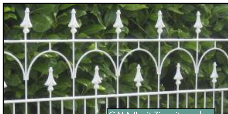
GALA II mit Zierspitzen oben

Als Montagebausatz zur Selbstmontage oder auch mit Montage durch unsere erfahrenen Montageteams lieferbar.