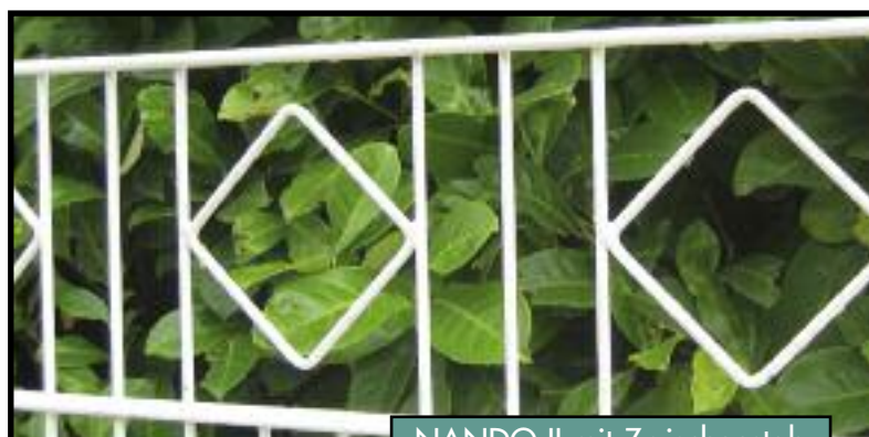
NANDO II mit Zwischenstab

Als Montagebausatz zur Selbstmontage oder auch mit Montage durch unsere erfahrenen Montageteams lieferbar.