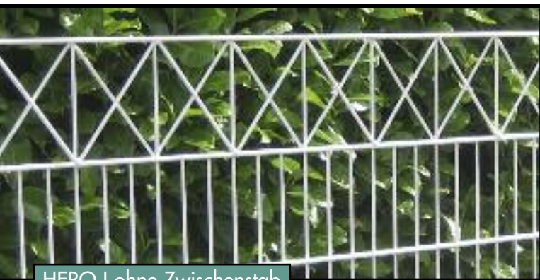
HERO I ohne Zwischenstab