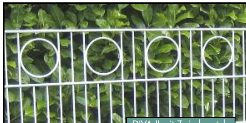
DIVA II mit Zwischenstab

Als Montagebausatz zur Selbstmontage oder auch mit Montage durch unsere erfahrenen Montageteams lieferbar.