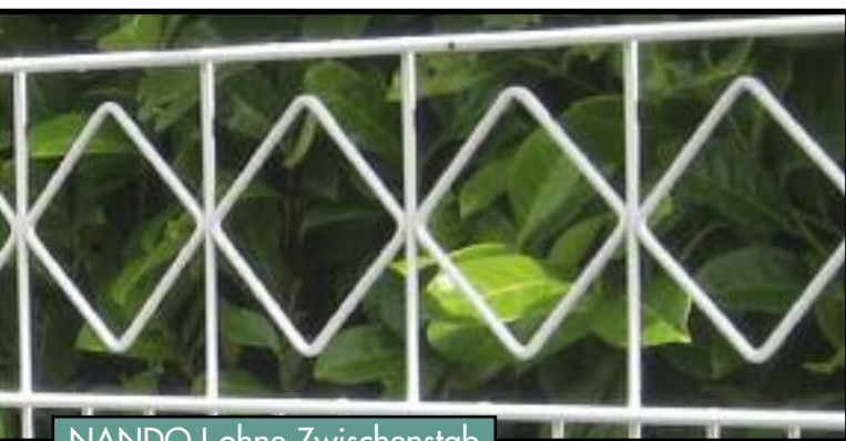
NANDO I ohne Zwischenstab