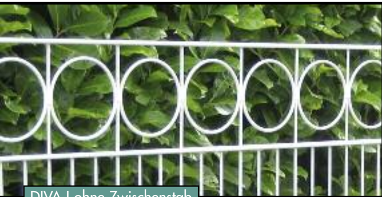
DIVA I ohne Zwischenstab